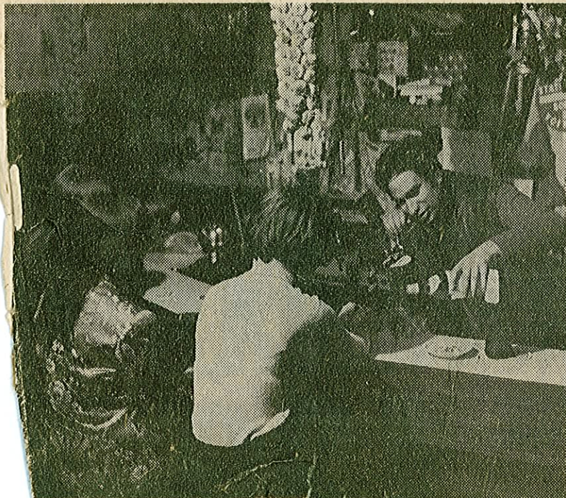
Enkele leerling-verpleegsters amuseren zich hier in de Middelburgse bar. Nu staan zij aan de rechterkant op het spel.