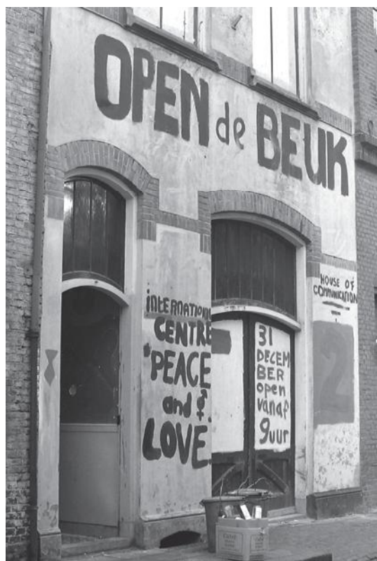
De zijgevel van De Beuk (Korte Giststraat), 1970.

Toen er een project draaide om 'non-conformistische jongeren' met behoud van uit-